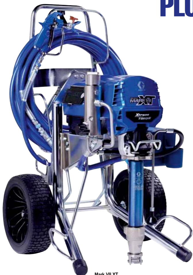
Mark VII XT ProContractor 19F744