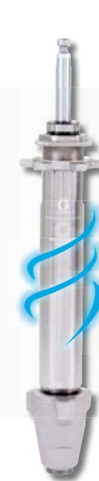
Pumpa Endurance Vortex MaxLife 6X dlhšia životnosť tesnení