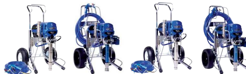
Mark VII XT ProContractor 19F744

PRELOMOVÉ FUNKCIE V CELOM RADE STRIEKACÍCH ZARIADENÍ XT