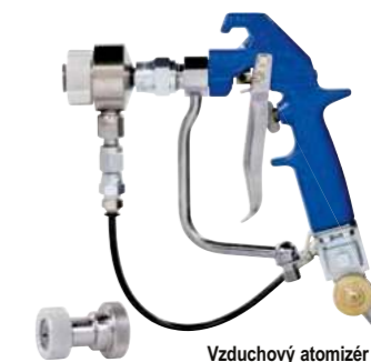
Vzduchový atomizér 18H255