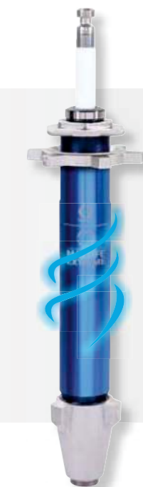
Pumpa Vortex MaxLife Extreme 3X zvyšuje životnosť piesta - podstatne znižuje náklady na prevádzku