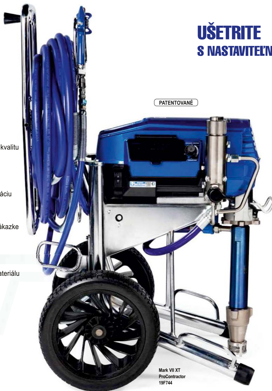
Mark VII XT ProContractor 19F744