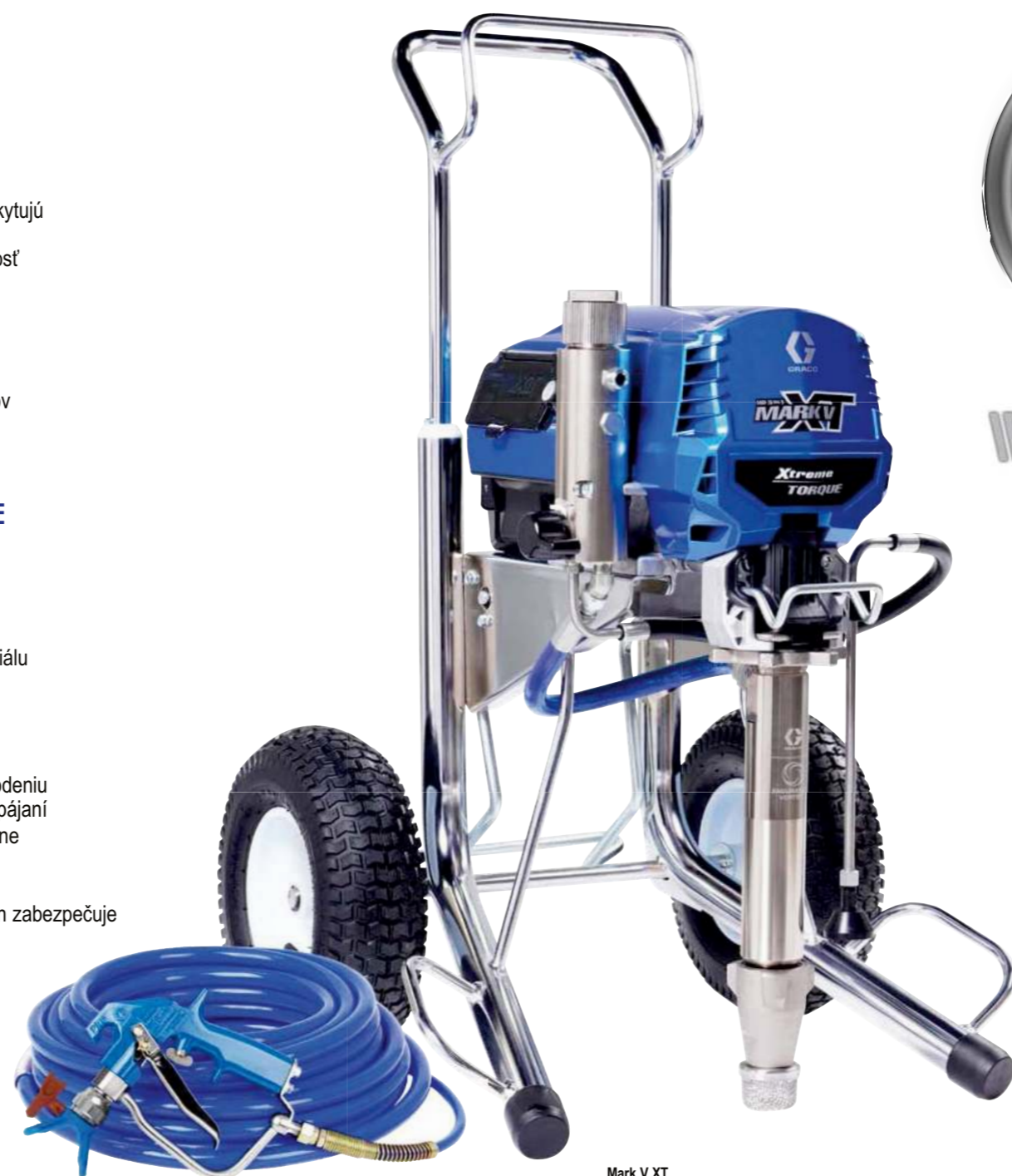
Mark V XT Standard 19F739