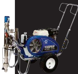
DUTYMAX™ GH230DI STANDARD