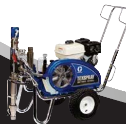
DUTYMAX™ GH300DI STANDARD