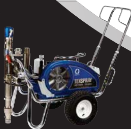
DUTYMAX™ EH300DI STANDARD