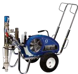
DUTYMAX™ EH230DI STANDARD